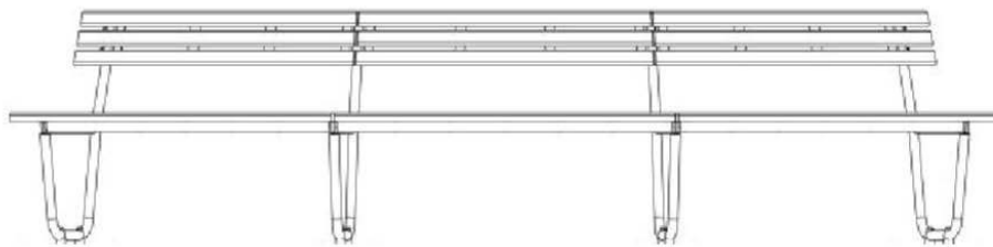
06.01.030 Bogenbank, mit Rückenlehne