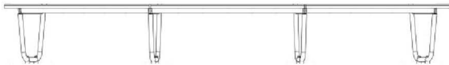
06.01.020 Bogenbank, ohne Rückenlehne